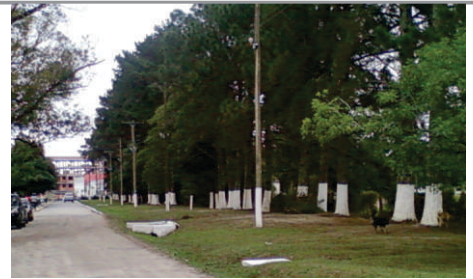
Manutenção da iluminação

Para os próximos meses, há previsão de pavimentação da estrada e do estacionamento, em parceria com a empresa Ecosul. Em projeto para captação de recursos, está programada a pintura externa dos prédios.