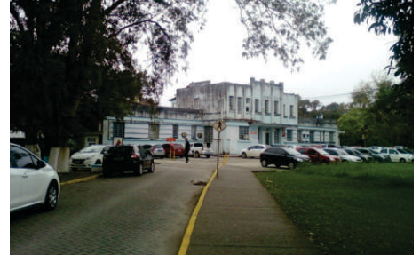
Manutenção do estacionamento