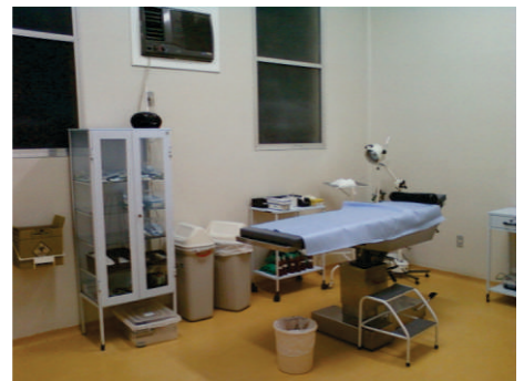
Reforma da sala de procedimento micro-cirúrgico