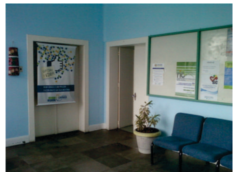
Pintura e reforma da recepção